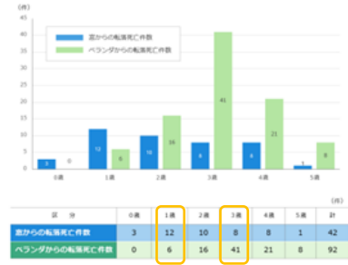
図1 窓及びベランダからの転落死亡者数

6歳未満の子どもの住宅窓およびベランダからの転落死亡事故は1993年から2024年の間に134件発生しているとのこと。窓からの転落事故は1～2歳が多く、ベランダからの連絡事故は2～4歳、特に3歳がダントツで多いようです(図1参照)。事故発生時における保護者の在宅状況は、在宅中が48%、残りは不在時に発生していますが、その数字には基本在宅中で「家族の送迎」や「ごみ出し」などちょっとした時間に発生している場合も含まれています。死亡には至らずとも怪我やヒヤリとしたことまで含めれば相当数発生していると思われる。詳細は以下のリンク動画もご確認いただき、家庭での安全対策を見直していただけたら幸いです。